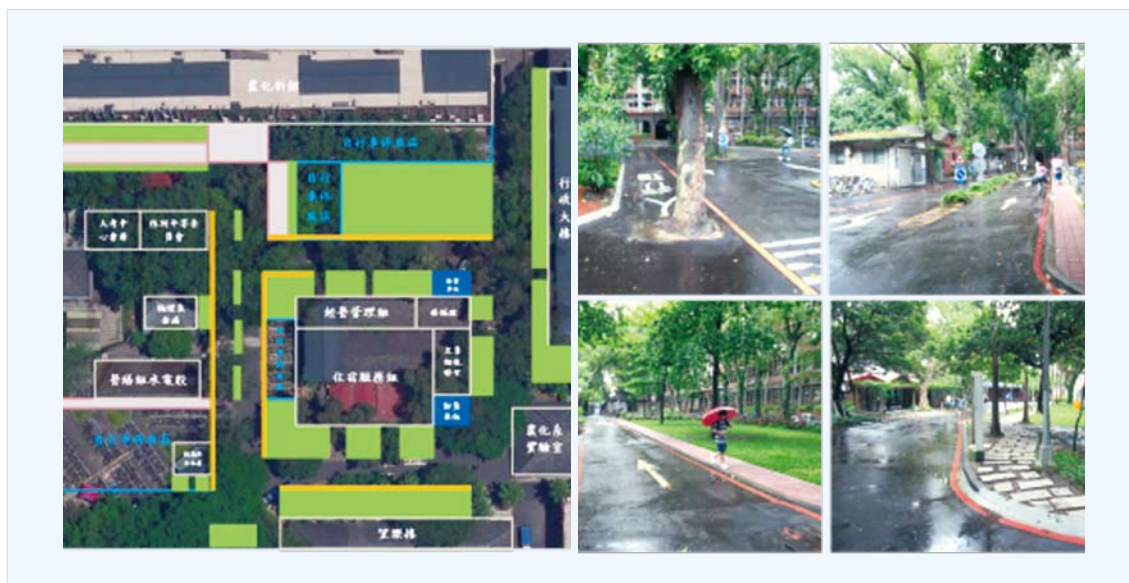
農化新館至望樂樓間道路重新規劃人行通道路網規劃圖及設置照片

為落實校園人本交通政策，達成人車空間分離，於農化新館至望樂樓間規劃人行通道路網，於農化新館前方右側設置標線型人行道，並於經營管理組對面與左側增設人行步道，亦於望樂樓北側設置石板步道，建構友善行人通行環境，俾利行人通行，本案已於 107 年 8 月 31 日施作完成。