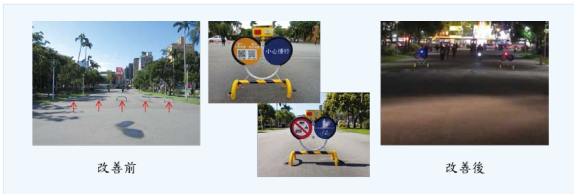
大學廣場交通設施改善前後照片

為改善大學廣場夜間通行安全，減少該區域車阻數量，並設置 2 座非固定式車阻，提昇車阻高度及增加自主性光源警示，除可提供校園地圖、相關交通指示及宣導等資訊，夜間亦可透過紅藍雙色警示燈予以警示，提高該區域夜間通行安全，本案已於 107 年 3 月 1 日施作完成。