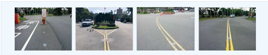
太陽能地嵌燈設置照片

為提高出入口、道路轉彎處等地點之夜間警示與安全，事務組於大門廣場、大門入口取票機、椰林大道、保健中心等區域共設置 24 座太陽能地嵌燈，前揭設施已於 107 年 3 月 1 日施作完成。