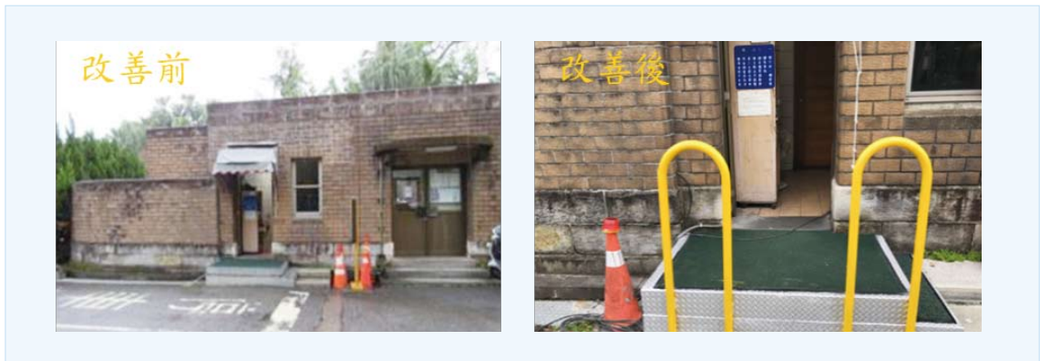
大門出口收費平台設置扶手欄杆改善前後照片

為提高身心障礙人員收費安全，避免跌落地面發生危險，於收費平台兩側增設輔助欄杆，扶手欄杆高度亦符合人因工程提供人員支撐，並於側邊加強夜間警示標示，已於 107 年 7 月 23 日施作完成。