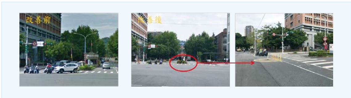
辛亥門前方道路交通安全改善前後照片

因校外常有車輛違規左轉復興南路，並常鳴喇叭逼迫行人及自行車通行，已影響本校人員交通安全，經與臺北市政府交工處協調後，於辛亥門前方設置五組回復型車阻及槽化線，已大幅減少車輛違規兩段式左轉，前揭設施已於 107 年 5 月 15 日施作完成。