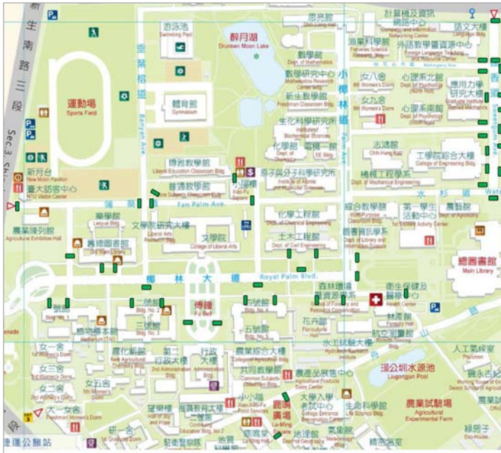
非固定式車阻立牌警示裝置及設置地點示意圖

事務組自行研發之非固定式車阻立牌警示裝置加以改善及修繕，除增加夜間警示燈具數量，加強燈座穩固性，亦提升夜間警示效果及安全性，本案共計 48 組，已於 107 年 5 月 3 日施作完成。