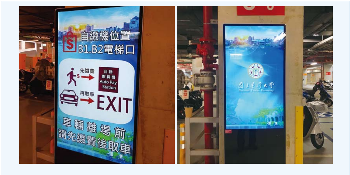
辛亥停車場公告燈箱設置照片

提供停車場使用者相關資訊，如先繳費後取車注意事項、管理中心提供悠遊卡加值服務、換油機服務說明、停車場須知、區域導引及指示、貼心提醒內容，利用公告燈箱輪撥方式，並可依需求隨時更新內容，本案已於 107 年 2 月 27 日施作完成。