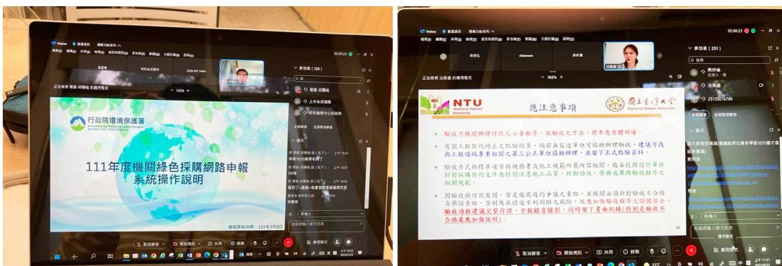
各單位同仁踴躍參與研習課程

111 年間共辦理 3 場教育訓練，包括線上「111 年綠色採購教育訓練」、「限制性招標應用」及「採購之履約管理及民事責任」等研習課程，冀協助各單位人員熟悉採購相關業務，提升行政效率。