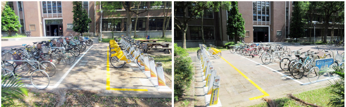
土木系館前方增設 YouBike2.0 柱位

配合土木系館前方自行車停放空間調整案，規劃系館前方 YouBike2.0 場站 10 席柱位遷移，並於左右兩側花園旁各設置約 15 席柱位，兩側合計 30 席柱位，共增設 20 柱，本案已於 112 年 5 月 19 日設置完成。