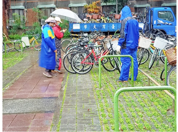
分區淨空 (第 4 區)

捷運站之自行車停放區納入例行性淨空作業區，及增加浮動式分區淨空作業方式（每學期規劃執行 3 次），112 年 1 至 12 月合計淨空 2,944 台自行車，淨空不僅清除久滯自行車，同時能整理該區環境，以提供教職員工生良好的停車體驗。