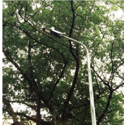
智慧路燈燈頭，上方突出物為控制器

公館、二活停車場的路燈於 1 月更換完成後，成效良好，於是又於 9 月擴大改善範圍，鹿鳴堂周邊道路的 57 盞路燈改為智慧節能路燈，有助於提升校園夜間照明品質。