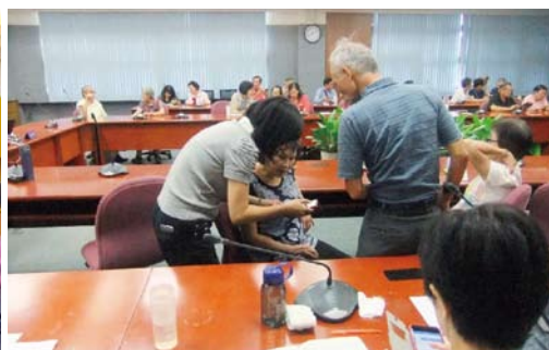
8月訪客中心舉辦志工大會 為志工大哥大姐介紹用手机查詢地圖