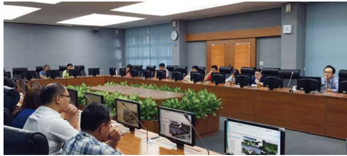
7月為一般使用者舉辦教育訓練