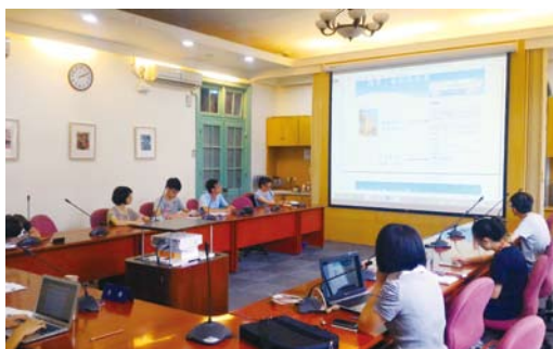
7月訪客中心導覽服務課 為同學介紹校園地圖