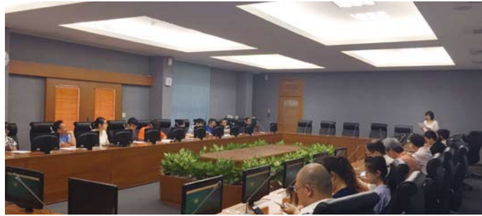
6月營繕組教育訓練，教同仁會勘時如何用手机查 GIS 資料

其中4月為駐警隊介紹使用總務處 GIS 系統和消防 GIS 系統，查詢與救災相關資料的方式；6月為營繕組介紹總務處 GIS 系統中，和工程相關的資料應用方式；7月為總務處同仁介紹總務處 GIS 系統的一般查詢功能；10月則為各單位資料管理者介紹圖資的更新操作、上傳方式，並討論圖資新增及維護等技術問題。