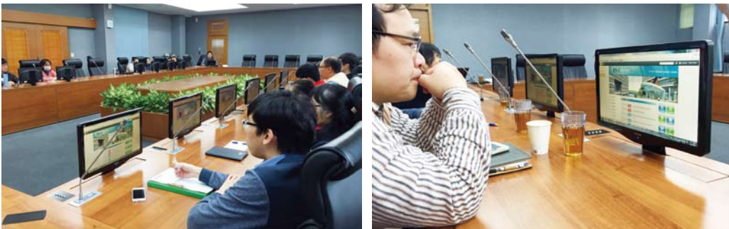
3 月 17 日辦理新版網站教育訓練

總務處網站自 2013 年起委由銳綸數位開發及維護，經過實際使用，本處人員持續與工程師討論修正問題，於 2016 年 4 月進行全面的網站程式改版，讓網頁維護操作更為直覺便利，同時也更正伺服器作業系統的問題，避免大量 log 檔和備份資料佔用伺服器儲存空間，造成網站效能降低。然而網站大改版後，發生部分資料無法顯示或遺失等問題，經過各組網管人員及銳綸工程師逐一改善，大致已回復正常運作。此外，本處網站使用向計資中心租用的虛擬主機，11 月底請計資中心協助將記憶體由 8G 增加至 16G，提升各組網站的讀取速度。