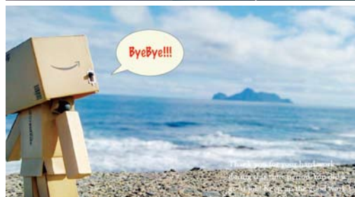
總務處雙月刊熄燈號