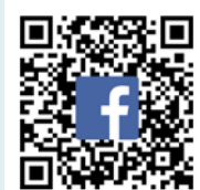
臺大出納組 Fb 分部辦公室

此外，透過粉絲專頁，也可讓顧客了解該單位的工作情形，而不是以該單位的產出結果評價該單位的效率，例如受款人不了解本校報帳流程，而誤以為出納組遲發薪水，因此出納組即使在校務建言回覆過，一段時間後仍會再出現新的抱怨。但是在發薪前於粉絲專頁貼文介紹報帳流程，當期就減少許多客訴電話。利用粉絲專頁，也可在突發事件當下，就貼文說明處理情形或立即的替代措施，顧客較容易理解，也讓單位承辦人有機會和顧客互動；在學雜費淡季時，則彙整校內訊息中有關學生權益的重要資訊，讓同學仍與出納組保持黏著度，有助於培養死忠顧客，提高