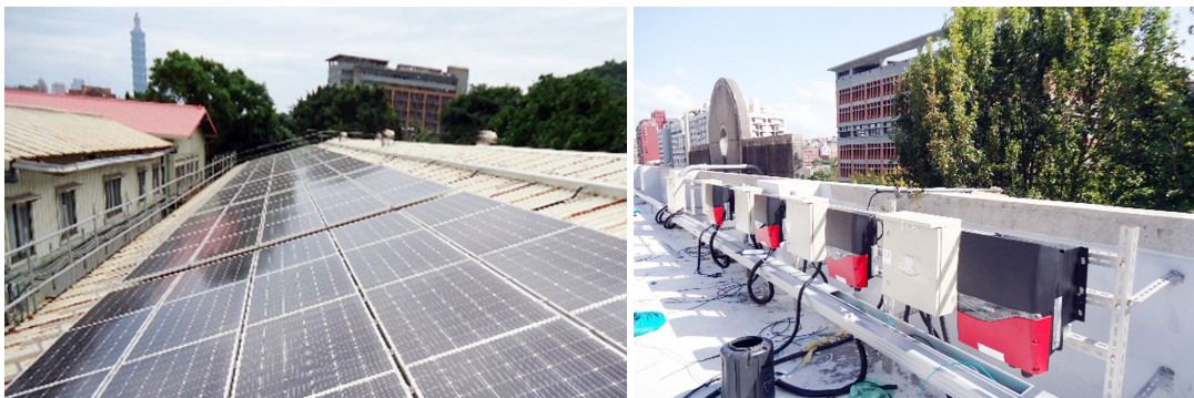
太陽能板及電力設備

本校電力大部分由台電供應，由於近年環保意識高漲，屋頂裝設太陽能板的系所逐漸增加，截至 112 年，學校校總區（含動科系）共有 11 個單位、總計設置容量約 475 kWp 太陽光電發電設備，部分電力賣給台電，詳細介紹敬請參考「重點工作 8-5 太陽能發電設備建置」。雖然太陽能發電量現階段僅用於建物內的走廊、廁所照明，但仍有助於達成節能減碳的目標。