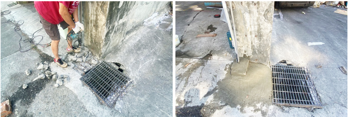
資源回收場漏水修繕