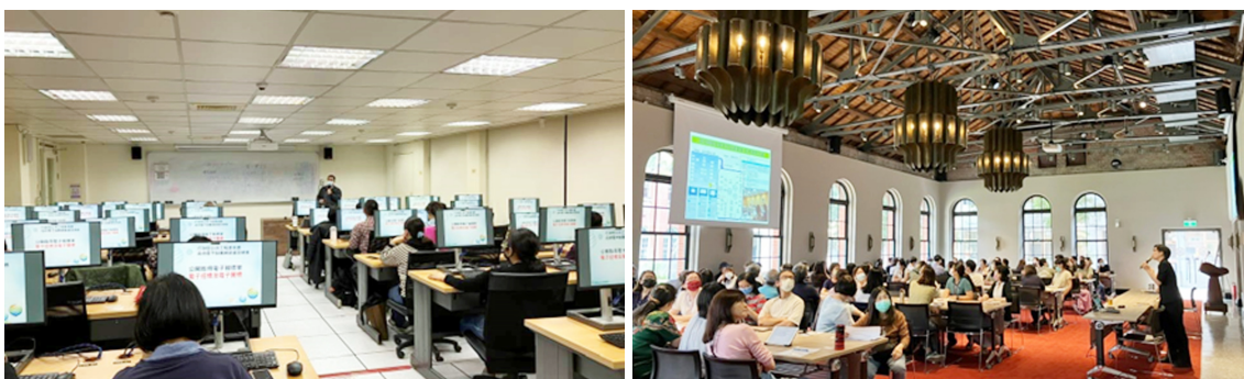
各單位同仁踴躍參與研習課程

112 年間共辦理 3 場教育訓練，包括「公開取得電子報價單 - 電子招標及電子開標」、「政府採購評選（審）實務」及「招標及開標階段常見問題解析」等研習課程，冀協助各單位人員熟悉採購相關業務，提升行政效率。