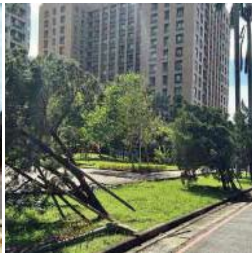
水源校區樹木災損情形