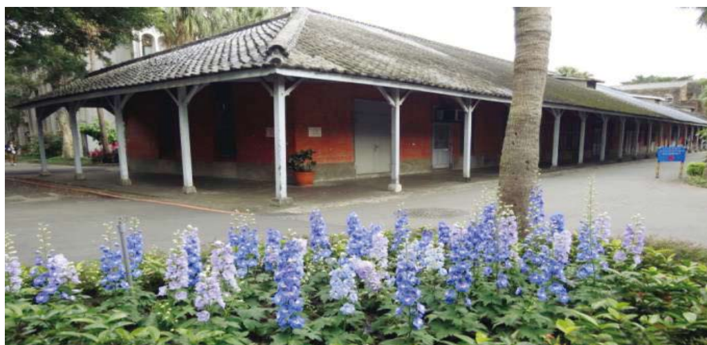
主計室綜合業務組前花園