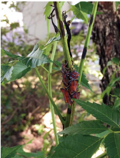
在欒樹枝條上群集的荔枝椿象

荔枝椿象自 103 年入侵本校後，已成為校園裡常見的外來種害蟲，無患子科的樹木如臺灣欒樹及龍眼樹都是荔枝椿象的攻擊對象，造成落花落果，或是枝條枯疽等嚴重危害；若蟲及成蟲受到驚嚇時會噴出具腐蝕性的臭液，可能造成皮膚灼熱或過敏反應。事務組於 105 年起委託昆蟲系辦理校園內的荔枝椿象防治計畫，今年 1 月起嘗試推動平腹小蜂的生物防治方法，藉由雌蜂會將卵寄生於椿象的卵中，使椿象無法孵化，因而消滅荔枝椿象，且可避免使用農藥，並降低人工移除感染枯枝的成本。今年夏天荔枝椿象成蟲較少，顯示此防治法見效，將持續追蹤效果。