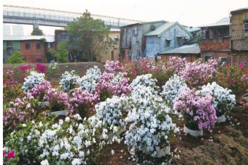
水源校區杜鵑花苗培育區

為節省公帑，事務組特向林務局索贈 950 株杜鵑花苗，並於水源校區及芳蘭路苗圃各開闢一處杜鵑花苗培育區，以培育優質杜鵑盆花於日後更替校園內老化或生長不良之杜鵑花叢。