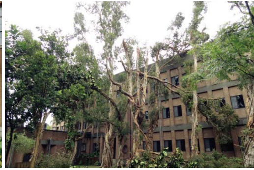
文學院白千層等樹木折斷