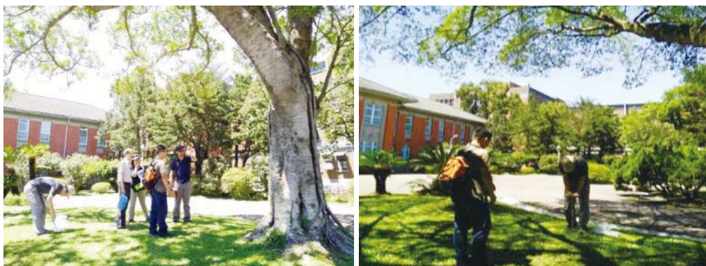
邀集校內專家一同為行政大樓東側正榕進行檢查

行政大樓前方兩株大榕樹，先前經校內專家學者會診表示因土壤硬實、透水性不佳導致樹勢逐漸衰弱，104 及 105 年已針對西側榕樹進行維護，今年 8 月再邀請本校園藝系及植微系專家一同進行檢查，同年 10 月請專業廠商進行東側正榕的土壤改良、增加有機質，以改善土壤的透氣性與保水能力。經觀察已有新葉長出，後續將繼續觀察其生長情況。