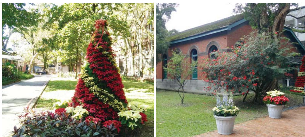
行政大樓後方及第一會議室前