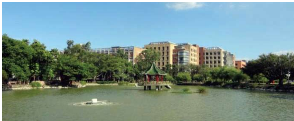
醉月湖及週遭植栽景色