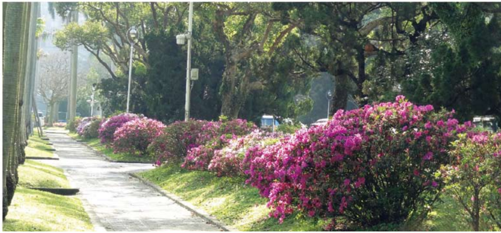
椰林大道 3 月杜鵑花盛開之美景

校園的鳳凰木在細心維護下，於 6 月驪歌響起時盛開，彷彿在祝福莘莘學子們，人生發展如同盛夏怒放的鳳凰花般，火紅非凡。