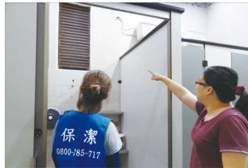
突擊檢查廁所清潔

委外辦理行政大樓、各系館及水源校區等處之廁所清潔維護工作，提供全校師生舒適之如廁空間。