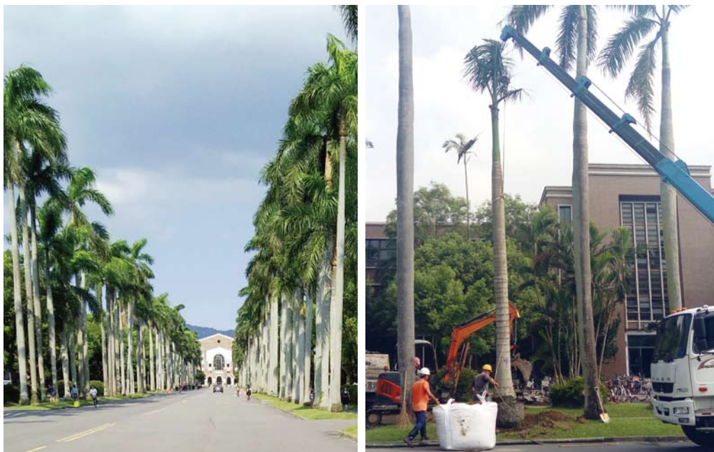
校園內大王椰子及蒲葵修剪

委外進行校園綠美化維護工作，包括舟山路沿線綠帶維護、校園內大王椰子及蒲葵修剪、醉月湖及生態池週遭植栽養護等，除了美化校園外，更兼顧生態復育。