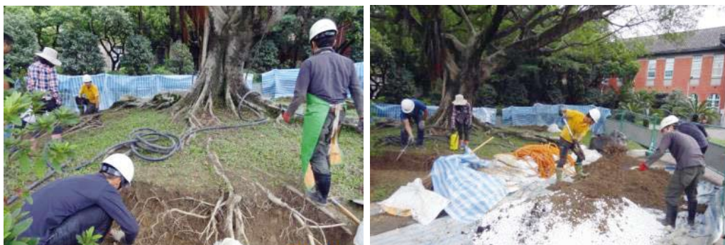
請專業廠商進行東側正榕的土壤改良