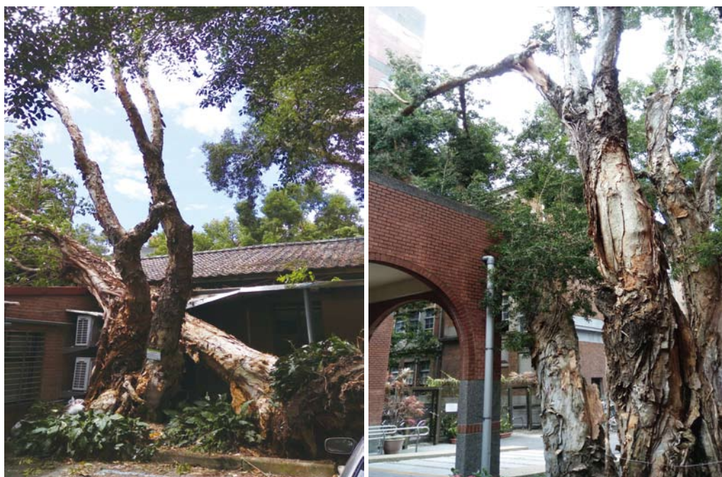
行政大樓周邊白千層傾倒及斷枝