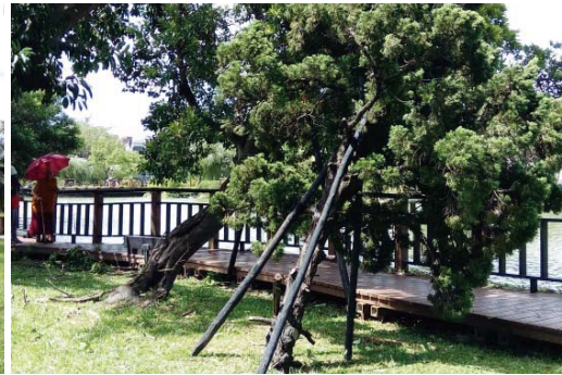
醉月湖龍柏、水柳傾斜