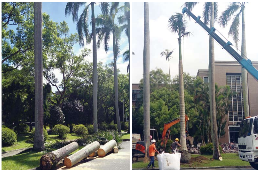
椰林大道之大王椰子為颱風吹倒，清除後予以補植

事務組於颱風季節前，進行水溝清淤及樹木修枝、固定等防颱作業，以期風災災情降到最低。7月29、30日，中颱尼莎襲台，校園計有42株喬木全倒、16株喬木半倒、39株喬木折斷，救災人員於連假期間共出勤29人次，於最短時間內恢復校園景觀。