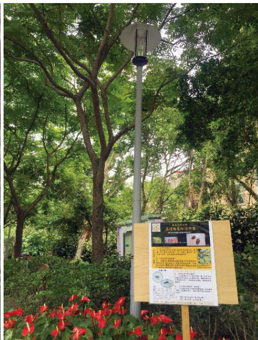
昆蟲系試辦荔枝椿象的防治計畫， 張貼告示牌讓師生了解防治方式