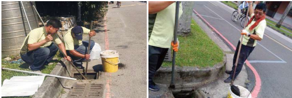
清潔股同仁辛苦挖除水溝淤泥

年至今年 11 月，已完成小椰林道、大氣系周邊、工綜館北側道路、楓香道、蒲葵道、舟山路農產品中心以西區域、垂葉榕道等區域的清淤作業，大幅減少淹水現象。