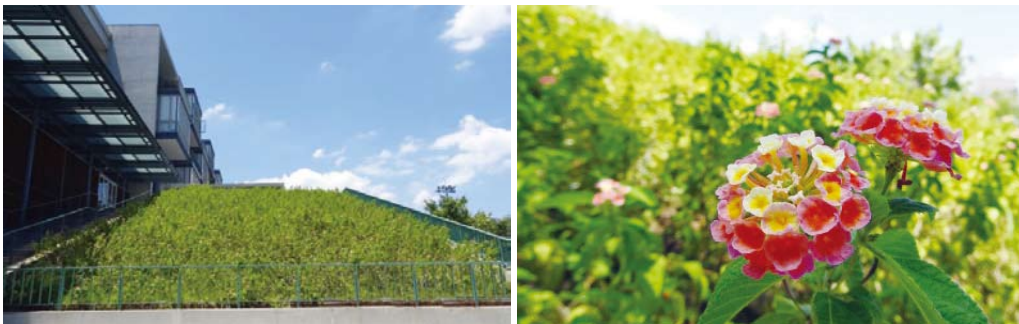
博雅教學館戶外草坡，馬櫻丹盛開