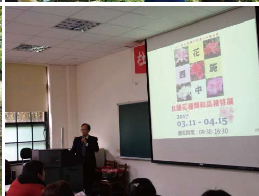
杜鵑花節校園導覽解說