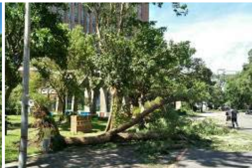
生命科學館前榕樹、紫檀傾倒