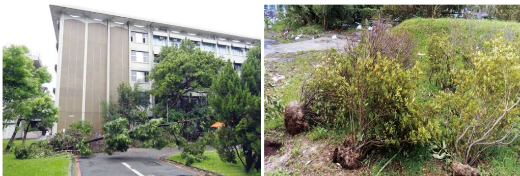
水源校區樹木災損情形