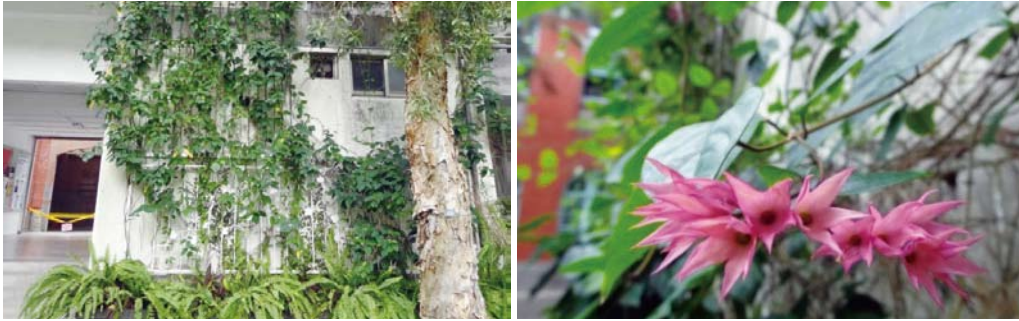
生活輔導組前綠牆，龍吐珠

持續配合本校永續校園計畫，於校園內設置養成式綠牆及綠屋頂之立體綠化，不僅具有隔熱、節能及景觀美化的功效，並可增加綠覆率，進而達成校園永續經營之目標。迄今校內立體綠美化面積達 2,690 平方公尺。