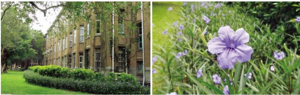
樂學館後方種植複層綠籬，以遮擋冷氣室外機，圖為盛開的翠蘆莉