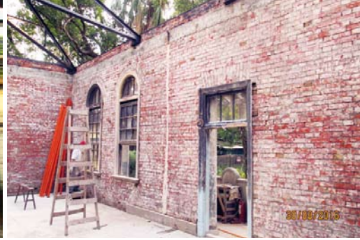
灰泥壁面括除清理