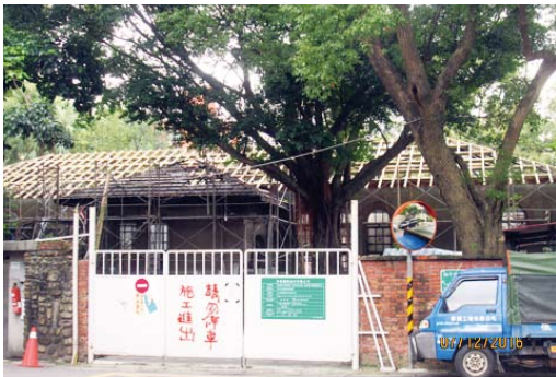
屋頂木架陸續架設