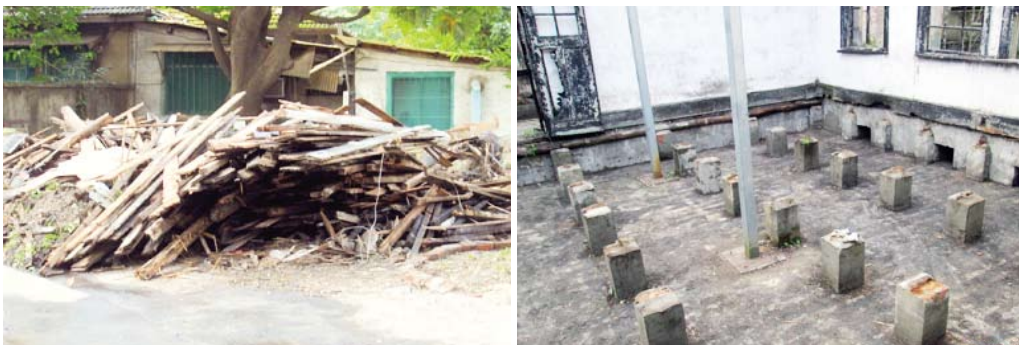
清理拆除燒毀之部份日式構件