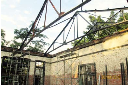
整修 / 重建屋頂構架