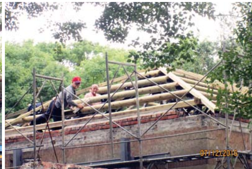
側面屋架梁柱陸續復原