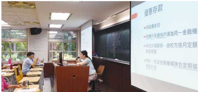
105 年度所得稅務暨報帳說明會