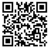
出納組 歷年滿意度 問卷調查結果