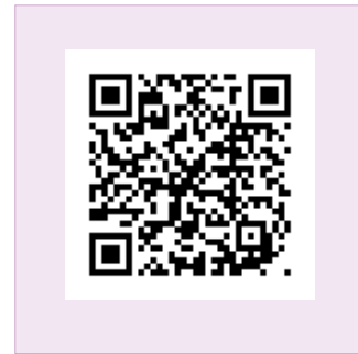
E 化帳務系統操作說明