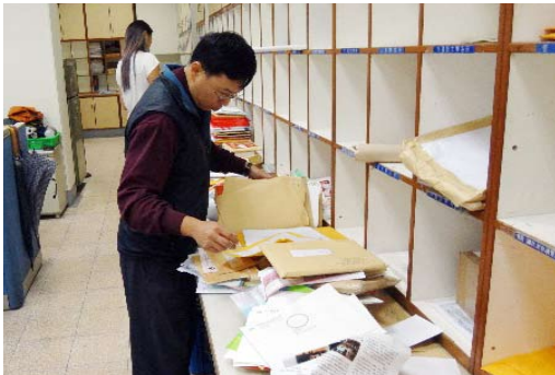
信件分送加強效率及準確率

因本校收受國內外信件，其收件人姓名、單位書寫不明之信件頗多，為加強查詢與解譯，除利用教職員錄、學籍資料及各搜尋引擎、電話連繫等網路系統等資源，盡力達成信件收送使命必達的服務，以強化信件遞送之達成率外，本年並以建立充實信件查詢資料庫之檢索資料庫等方式廣續強化不明信件查詢，經統計 104 年資料，總共查詢 12,359 件，查詢到件數為 11,472 件約佔查詢信件總數 92%，其中國內郵件約佔 6 成，而國外信件部份則為 4 成。