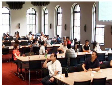
開標實況、全程錄影