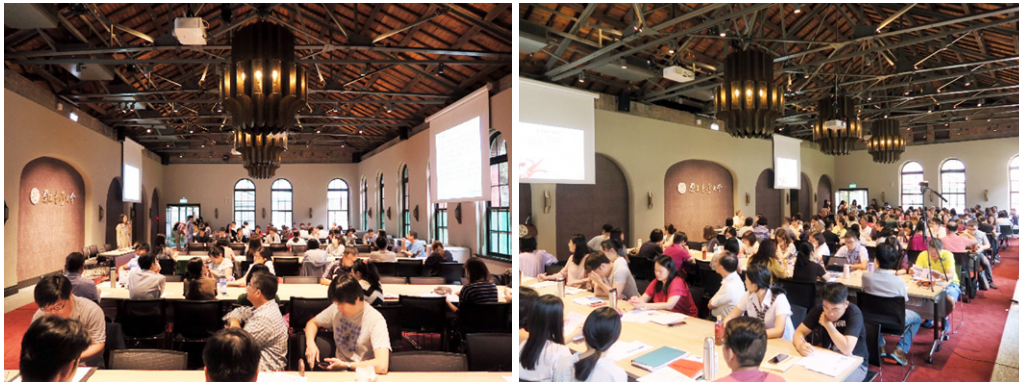
各單位同仁踴躍參與研習課程

108 年間共辦理 6 場教育訓練，包括 108 年綠色採購教育訓練、圖利與政府採購法相關案例、勞動權益與相關法規教育訓練、身心障礙優先採購教育訓練、常見採購問題探討及從專業採購談人生決策術等研習課程，冀協助各單位人員熟悉採購相關業務，提升行政效率。