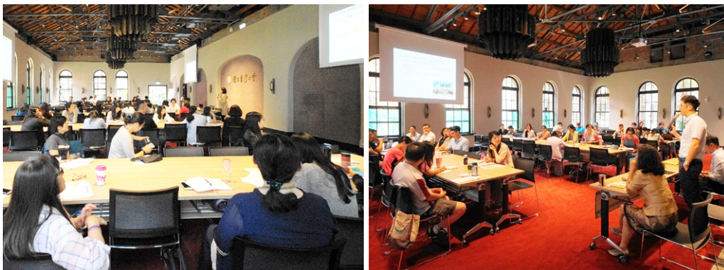
108 年綠色採購教育訓練課程