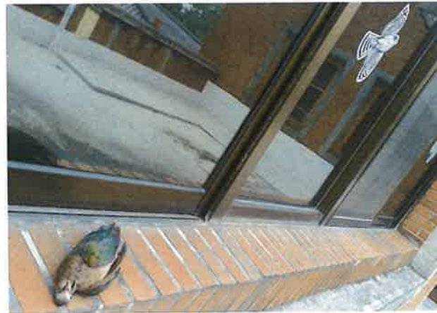
貼稀疏的猛禽貼紙無法預防野鳥窗殺。