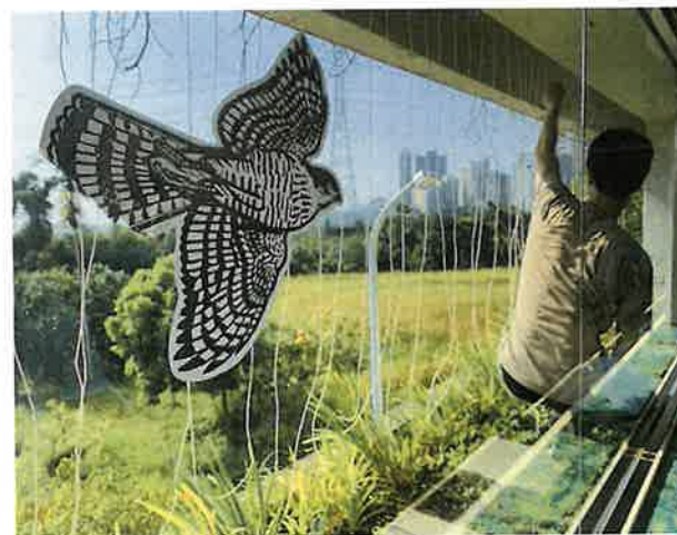
以戶外掛繩的方式來預防野鳥窗殺。