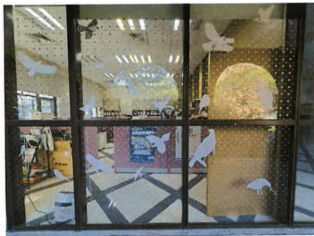
臺灣大學思亮館之鳥類友善窗戶布置。

過去曾提倡使用猛禽圖案的貼紙來防止窗殺，已被證明無法嚇鳥不靠近玻璃，許多張貼稀疏猛禽貼紙的建物仍持續地有野鳥撞窗事件發生。若要使用猛禽貼紙，也要符合「5x10公分原則」來張貼才會有效，可以配合其他的素材，例如圓形標籤貼紙、直條貼紙等來合併布置改善。過去建築物常使用的鐵花窗、壓花玻璃、馬賽克玻璃等其實都是很好的鳥類友善建材，可惜近年來已經不流行了。若您家中、學校、工作場所會有野鳥撞窗，可以嘗試用「5x10公分原則」來布置玻璃，也歡迎大家遇到野鳥窗殺事件能通報臉書社團「野鳥撞玻璃回報」或「台灣路死動物觀察網」，若是想要了解更多窗殺資訊或下載摺頁與教育宣導資訊，歡迎上「野鳥窗殺博物館」網站逛逛。