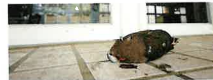
翠翼鳩是國內窗殺第二名