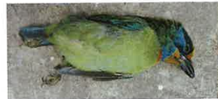
五色鳥是國內最容易窗殺的鳥種