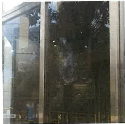
鳩撞窗的鳥拓痕跡

猛禽會與臺灣大學根據「台灣路死動物觀察網」與臉書社團「野鳥撞玻璃回報」所蒐集的近900筆窗殺案例分析，發現五色鳥與翠翼鳩為最易遭窗殺死亡的鳥種，而屬於猛禽的鳳頭蒼鷹亦是名列前茅，這些容易窗殺死亡的鳥類稱為超易撞鳥種(super colliders)。國內超易撞鳥種大多為留鳥，與北美研究多為候鳥很不一樣。