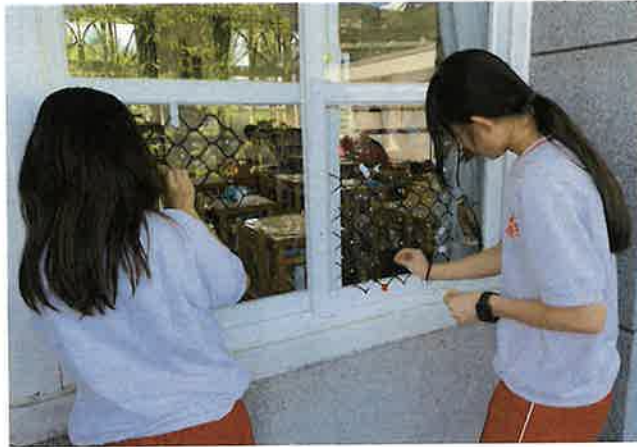
八里國中的學生正在改善教室玻璃。

鏡像反射也是光滑玻璃的特性之一，最普通的透明玻璃在室內暗、室外亮的條件下，也會產生明顯的鏡像反射，若反射對側的樹林、遠景或建築物之間的影像，就會讓鳥兒誤判鏡中的假影是真實世界而全速飛過去，因此導致嚴重的撞傷或死亡。鳥類的飛行能力讓牠們不受空間與高度限制，雖然許多鳥類的視覺和對色彩的辨識能力其實比人類還好，但因為眼睛在頭部的兩側，視野範圍較廣但立體視覺比人眼範圍小，加上高速飛行狀況下反應的時間很短，因此善飛的鳥成為窗殺最嚴重的受害者。