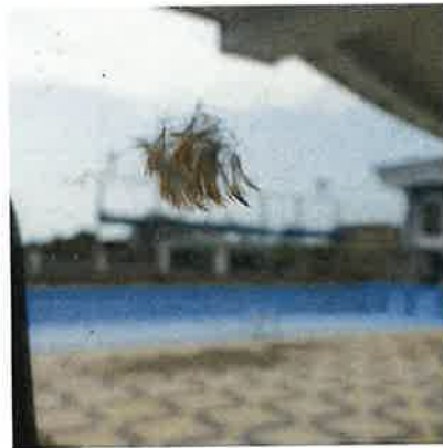
某小型鳥撞窗遺留的羽毛痕跡