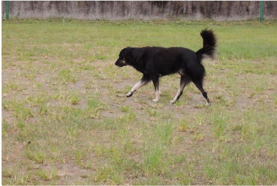
小安(公)-已絕育已剪耳 特徵:白腳、長毛、折耳