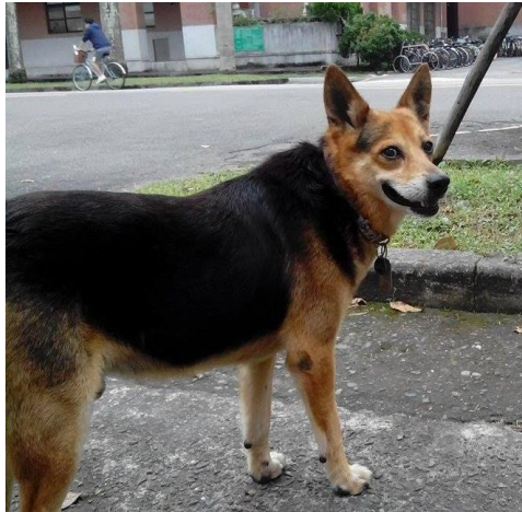
小狼犬(公)-未絕育，有項圈，親人 黑狗(公)-未絕育，紅項圈，親人