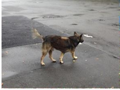
黑黃(公)-已絕育已剪耳