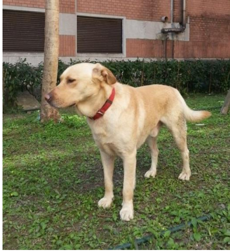
Lucky (公)(居民放養家犬)未絕育未剪耳