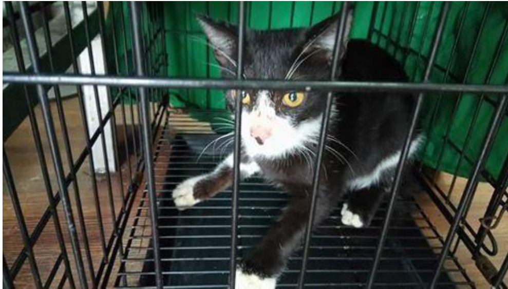
男七黑黑白(已絕育)