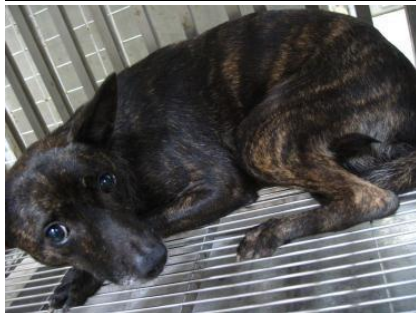
虎斑母狗 (已絕育已剪耳)