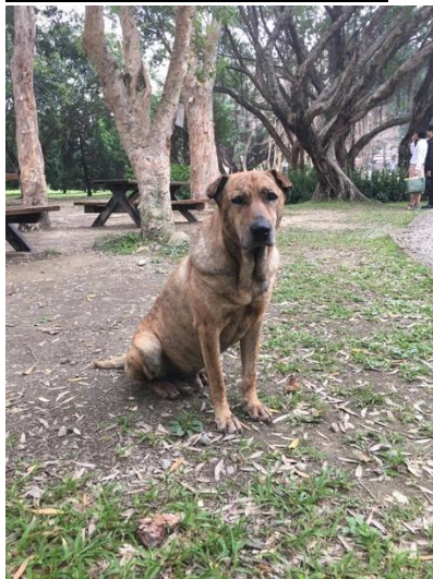
湖仙子男友(公) - 為退休員工飼養犬隻 ◎此區常駐貓照片: 無常駐貓。