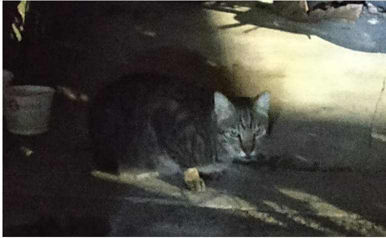
大一女灰虎斑(已絕育)