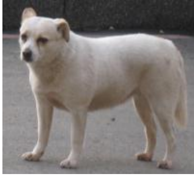
白狗(荷包蛋)(母)－已絕育已剪耳