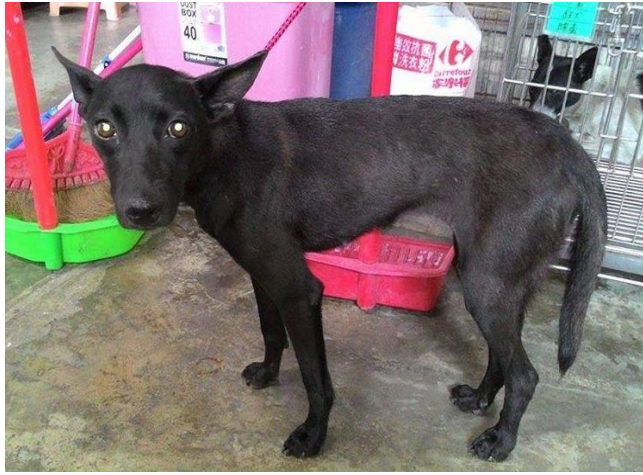
小小黑(母)-已絕育已剪耳,已由農化系老師領養 ◎此區常駐貓照片: