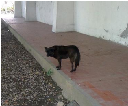
湖仙子(母)-已絕育已剪耳