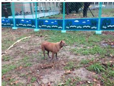
胖黃(公)-已絕育已剪耳