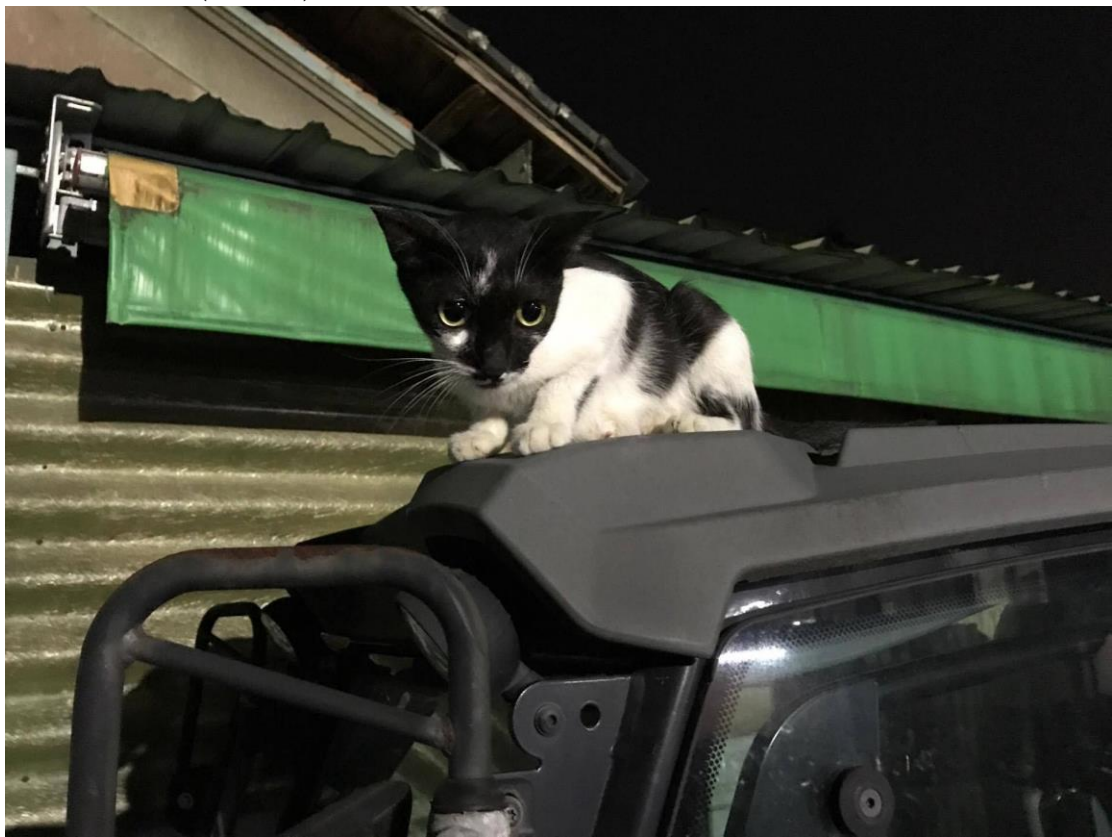
大一女黑白媽媽(已絕育)