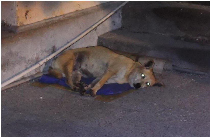
小黃(母)已絕育已剪耳