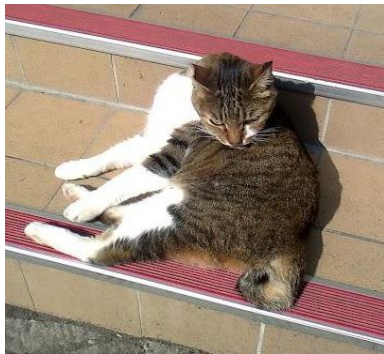
盆栽(母，已絕育) 從 107 年 7 月起失蹤